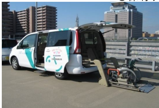
●セレナ(リフトタイプ)