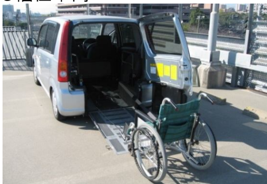
●ムーヴ(スロープタイプ)